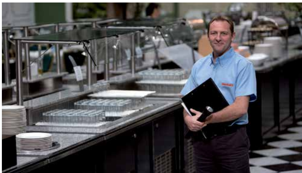
Entra nel Mondo Rentokil

Attualmente il Gruppo Rentokil Initial opera in Italia attraverso le due divisioni Initial Hygiene e Rentokil Pest Control , garantendo l'erogazione di servizi in modo capillare su tutto il territorio nazionale attraverso le sedi operative.